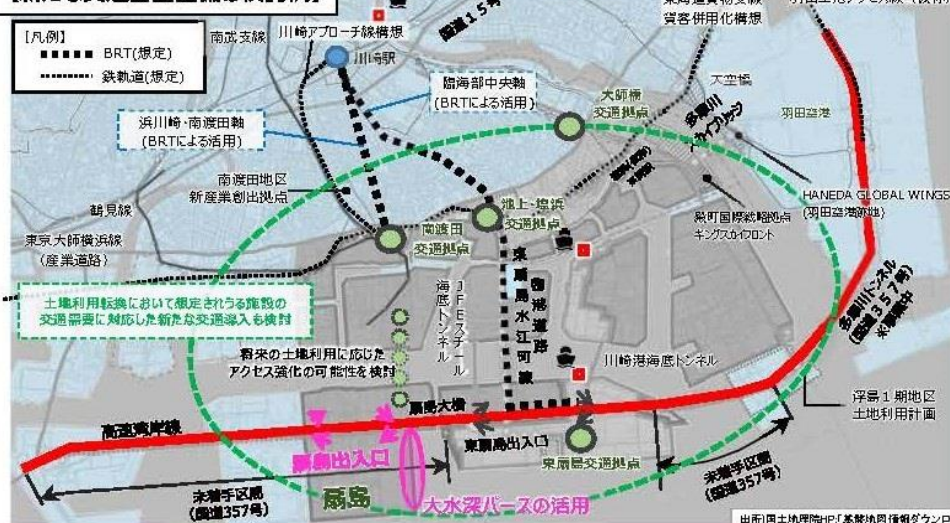
↑ 新たな交通基盤整備の検討例